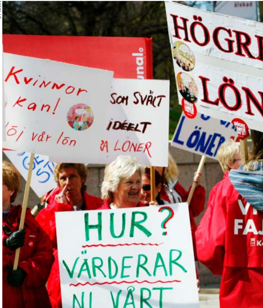
Strejkande kommunalanställda utanför Kommunförbundet i Stockholm, 2007.

En mångårig politisk kamp handlar om hur EUs minimiregler för arbetstider ska förändras. Europafacket kräver att jourtid ska räknas och att det inte ska gå att ha undantag från gemensamma regler. Gunnar Hökmark gör tvärtom. Hökmark vill inte att EU ska reglera arbetstiden överhu-