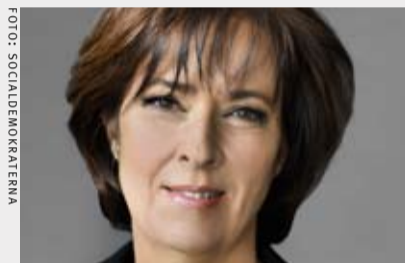
Mona Sahlin, ordförande Socialdemokraterna

– Helst röstar jag i vallokal på valdagen, det är högtidligast. Om inte det fungerar i år går det lika bra att förhandsrösta. Som ordförande i IF Metall är jag stolt över att ha flera av våra medlemmar med på den socialdemokratiska listan. Jag röstar för ett rätt Europa och ett EU som ställer upp på kollektivavtal och fackliga rättigheter.