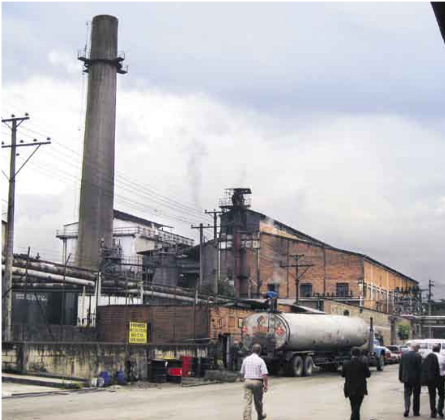
Colombias textilindustri försöker att klara en svår strukturomvandling.