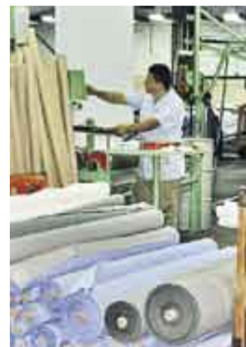
Företaget försöker nu möta krisen genom permitteringar.