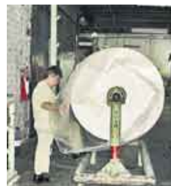
Coltejers textilier tillverkas idag billigare i andra länder.