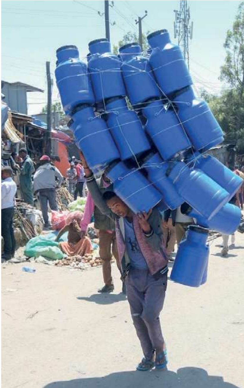
Bra arbetsmiljö är ett viktigt mål för det fackliga utvecklingssamarbetet.