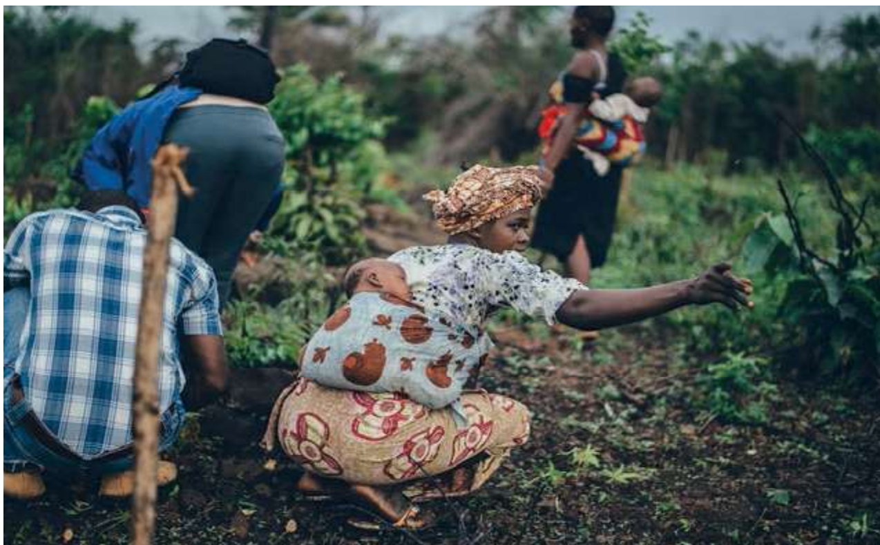
Hårt och slitsamt arbete är vardag för många kvinnor.