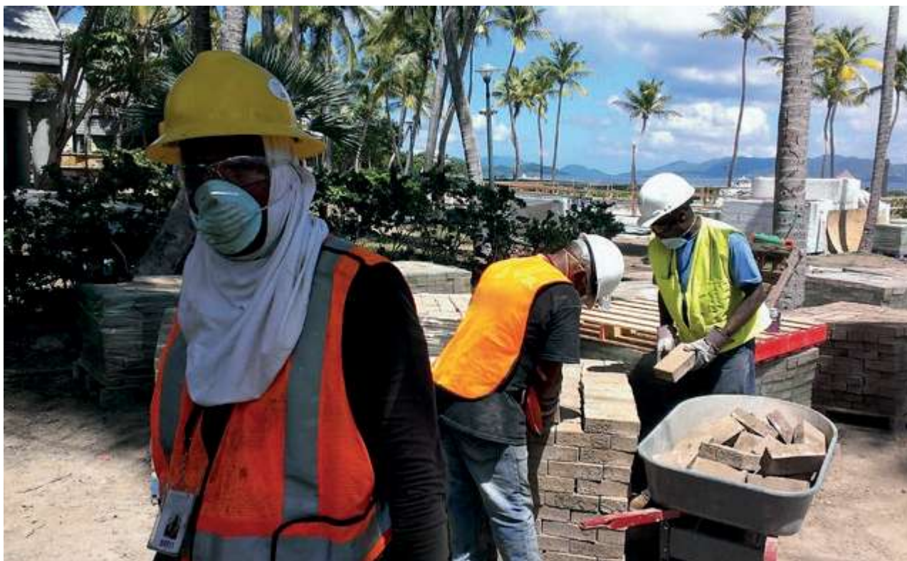
Världens arbetare är en nyckel i klimatomställningen.